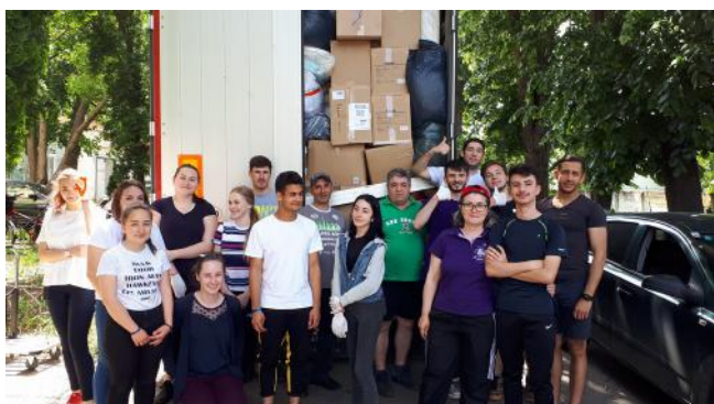
Echipa FAVOR la Bacău, cu TIR-ul de ajutoare.

Consilierea, rugăciunea și vizitele de follow-up joacă de asemenea un rol important în vizitele acestor familii. Pe lângă ajutorul material, voluntarii FAVOR încercă să ofere speranță și încurajare celor care au atât de puțin.